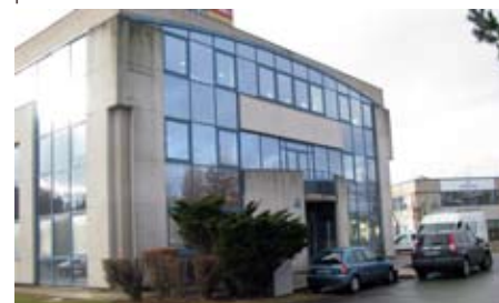
» Nouveau centre d'Ecully

Le 13 février 2009, le nouveau centre médical d'ECULLY ouvrira ses portes, en remplacement des centres de Dardilly et Limonest. 4 équipes médicales y œuvreront. Faciles d'accès, plus spacieux, plus confortables et avec des plateaux techniques modernisés, nous espérons que ces nouveaux centres médicaux répondront mieux à vos attentes.